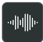
Expérience audio Optima