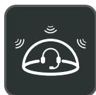
Technologie Acoustic Shield

Le Yealink WH66 est le casque sans fil DECT leader du secteur. Avec les modèles WH66 Dual et WH66 Mono, il offre une toute nouvelle forme de collaboration de bureau. Parfaitement compatible avec les plates-formes de communications unifiées, il s'intègre en mode natif avec les téléphones IP Yealink. L'écran tactile capacitif de 4,0 pouces (480 x 800) de la base offre une nouvelle expérience de travail, pour tout contrôler d'une simple pression. Il joue le rôle de poste de travail, gérant les appels téléphoniques, se connectant à plusieurs appareils (téléphone de bureau/téléphone mobile/ordinateur), chargeant les téléphones mobiles sans fil, et jouant même le rôle de haut-parleur. Cerise sur le gâteau, cette station de travail multifonctionnelle fonctionne directement dès que vous la branchez. Les choses deviennent plus simples, avec un plus grand confort pour l'utilisateur.