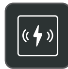
Chargeur sans fil Qi