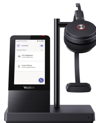
WH66 Mono/Dual: Teams WH66 Mono/Dual: UC