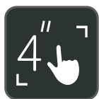
Écran tactile LCD