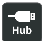
Concentrateur USB intégré