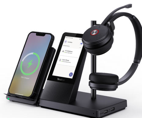
WH66 avec chargeur * Le chargeur sans fil est en option

Busylight est activé dans le WH66. Lorsque la lumière sur le casque ou le BLT60 sur le bureau s'éclaire en rouge, les gens autour de vous savent que vous êtes au téléphone, et évitent ainsi de vous interrompre involontairement. Vous pouvez vous concentrer sur la conversation, ce qui permet une plus grande efficacité et une meilleure collaboration.