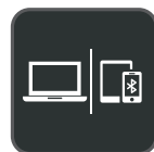
Connexion à plusieurs appareils